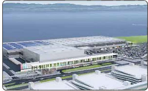
愛知県国際展示場の建設（空港島）