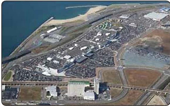
開発が進む空港対岸部（常滑市）