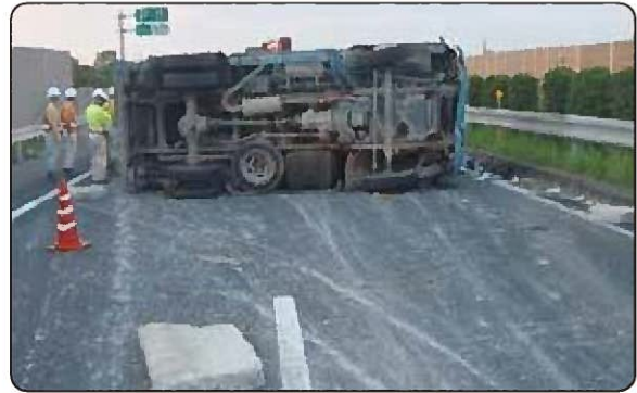
知多半島道路の交通事故状況