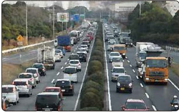
国道 247 号の渋滞状況（東海市）