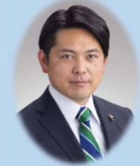
東海北陸自動車道南伸建設促進期成同盟会参与 岐阜市長 柴橋正直

一宮西港道路の早期実現が、地方創生及び国土強靱化の推進やストック効果の発揮に繋がるものとして期待しております。