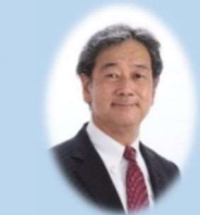
東海北陸自動車道南伸建設促進期成同盟会参与 高山市長 田中 明

高山市にとってインバウンド等による観光は重要な基幹産業になっています。その観光産業の更なる振興として、地域を繋ぐ東海北陸自動車道、中部縦貫自動車道が効率的に中部国際空港とアクセスができる一宮西港道路の整備は大変重要であるとともに、広域的な道路ネットワークの構築は有効なストック効果が図られるものと期待しております。