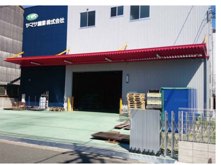
昨年12月に第6工場稼働、新レーザー加工機導入など設備投資を積極的に行なっています

2002年、社長に就任したときの最初の朝礼で、社員に向けて「世界に通じるパイプ技術確立し、周りを幸せにします」と宣言しました。この目標を達成するため、最新のIT技術と職人の技をつなげ、自社の技術レベルをもう一段階上に引き上げたいと考えています。