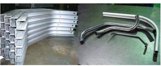
曲げ加工されたパイプ・異形鋼管 ももとは素材の卸売のみを行なっていましたが、限られた市場の中で、は、既存の業態のまま売上をあげていくのは難しいと感じていました。そこで、鋼材の曲げ

社長に就任してからの15年間で、業績を約5倍に拡大できました。その理由は、「仕事の幅を決めなかった」ことだと思えます。