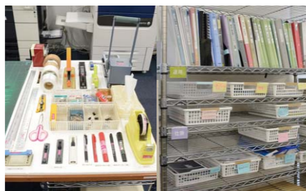
全体共用備品の管理 仕事の見える化に繋がった仕掛け棚

▲ 全編英語で制作された、株式会社Advanced Driver Information Technologyのコーポレートサイト。世界中で注目されているWEBデザインアワード「CSS Design Awards」のSpecial Kudosを受賞しました。