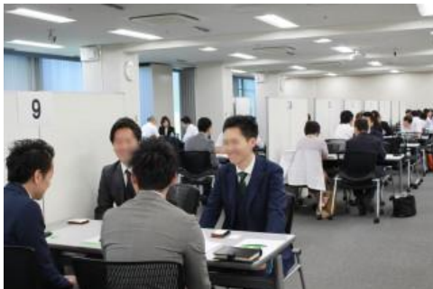
対面式にて1,238件の商談を実施