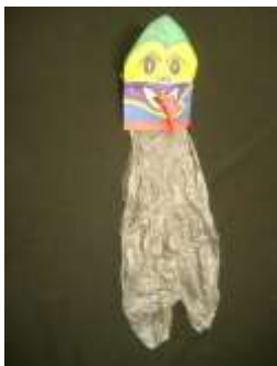
てくてくトッピィちゃん

【午後の部】ホバークラフトを作ろう! プロペラで浮上し、前進するホバークラフトを作ります。 発想工作ゲームも体験していただけます。